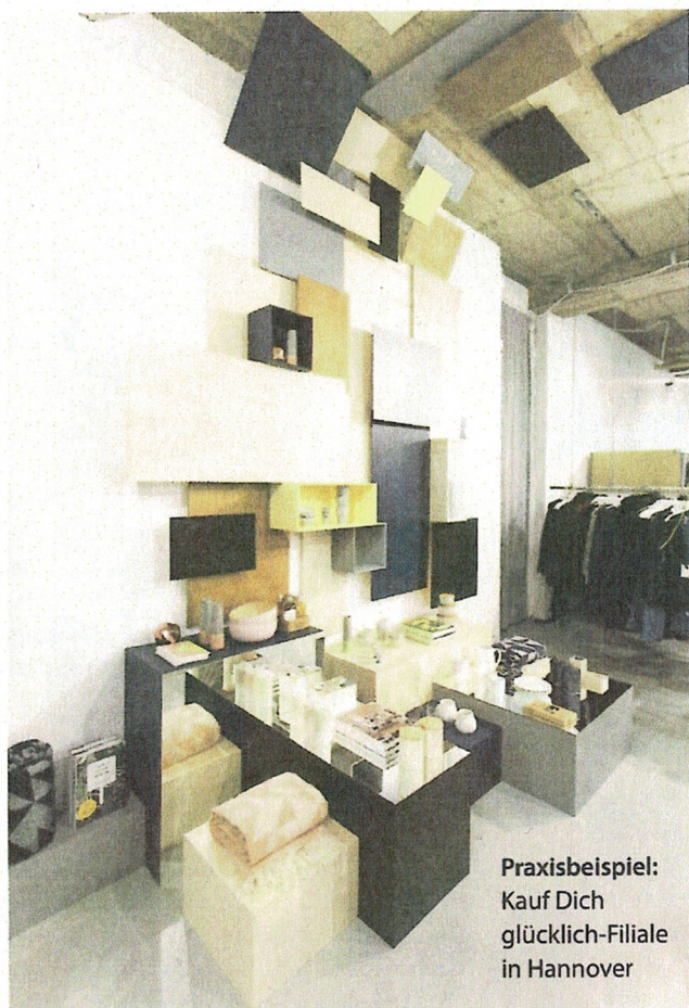
Praxisbeispiel: Kauf Dich glücklich-Filiale in Hannover